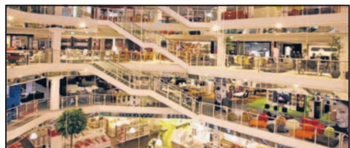
Ein großzügiges und vielfältiges Angebot erwartet die Kunden.

Die Wirtschaftsunioren Karlsruhe loben erneut den mit Preisgeldern in Höhe von insgesamt 5.000 Euro dotierten „BFamily Award“ aus. Gesucht wird das familienfreundlichste mittelständische Unternehmen der „TechnologieRegion“. Unternehmen müssen sich darauf einstellen, dass Fachkräfte knapp werden und dass sie um Mitarbeiter durch familienfreundliche Angebote werben müssen. Unter www.bfamilyaward.de kann der Fragebogen zur Ausschreibung ausgefüllt oder heruntergeladen werden. Einreichungsfrist ist der 27. März. (ps)